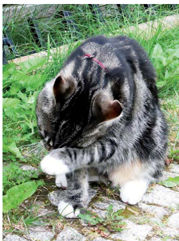
Kot Simba, właścicielka: Ewa Komorowska

W ludowych wierzeniach kot może również zwiastować chorobę lub stanowić na nią lekarstwo: